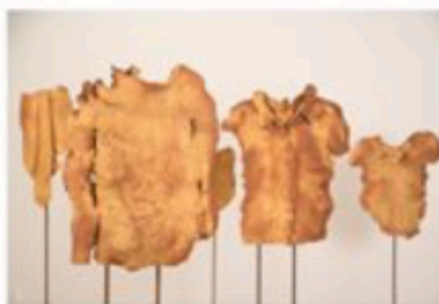
Kroppar av Börje Eriksson.